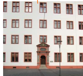
Seminarort Journal. Seminar Alte Universitätsstr. 17