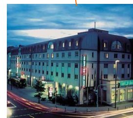
Hotel ibis Hotel Holzhofstr. 2