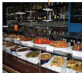
Abendliches Treffen Taperia barrio alto Gaustr. 19 (Montag, 24.09 und Mittwoch 26.09.)